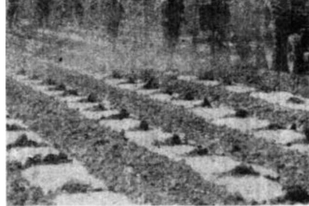
上图：广北农场抢播棉花，截至12日，全场已完成播种任务5000余亩。下图：东营区对棉花播种工作十分重视，各级干部经常深入田间地头，指导搞好春播。