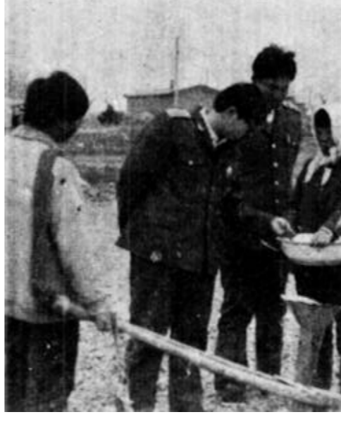
水利是农业的命脉，国家和地方投入大量人力物力进行水利建设，为的是能为农业生产带来更大的丰收。

严格按资质标准对企业内实行动态管理，并首次对四家经营管理较差的企业限期整顿，使这四家企业的内部管理和素质得到了不同程度的提高；三是强化人员培训，及时下达培训计划，并积极引导、组织企业进行人才培训，全年累计为企业培训合格专业人61人，为企业培训了71名项目经理；四是协助企业办理资质升级手续，去年帮助区市政工公司、区建材公司由原来的三级晋升为二级，区二建由原来的四级晋升为三级，增强了他们的市场竞争能力。（韩松青）